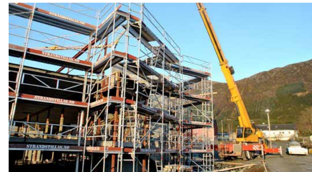
Det nye helse- og omsorgssenteret i Vanylven føres opp i stål og betong. Bygget skal overleveres 1. februar 2014, og fremdriften er god.