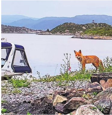
NYSJERRIG: En tam rev har i flere år vært på Buarøy i Lerøyosen. Den kommer gjerne hvis noen legger til kaien.

TORS DAG 1. SEPTEMBER 2022 BERGENSAVISEN