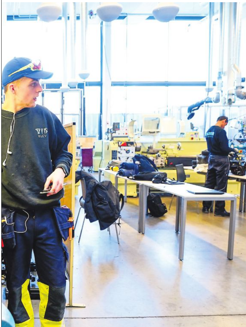
ildet er fra en skole i Oslo.