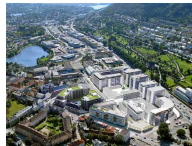
Kronstadparken slik den vil fremstå ferdig utviklet.

Brødrene Ulveseth AS ble etablert i 1932. Det familieeide firmaet med kontor i Godvik er en velkjent entreprenør- og murmesterbedrift i regionen. Virksomheten spenner over mur- og betongarbeid, betongsaging og kjerneboring, elementproduksjon og eiendomsforvaltning. Firmaet har 107 ansatte, hvorav 12 lærlinger. Brødrene Ulveseth har gjennom de senere år hatt sterk vekst og oppnådd gode resultater.