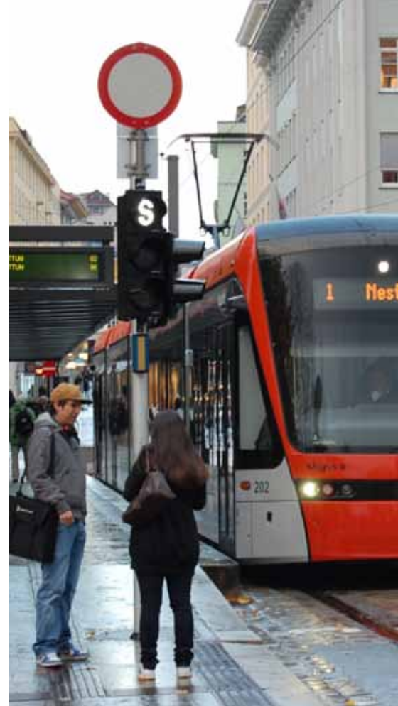
FORHINDRET KRISE: Bybanen har vært og vil fortsatt være en "motor" på anleggssiden i vår region.