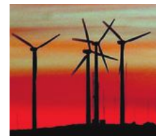
VINDMØLLER: Vindmøller i solnedgang.

■ Selv må jeg innrømme at en vindmølle her og der bekymret meg lite, helt til jeg fulgte NRKs «sommerskute», Statsråd Lehmkuhl, på dens ferd langs norskekysten. Da avslørte de kraftige TV-linsene at kysten vår faktisk er pepret med såkalt bærekraftige «vindmøllerparker». Noe bedre ble det ikke